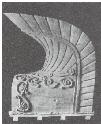
試作復元された法隆寺金堂鷗尾（1954）